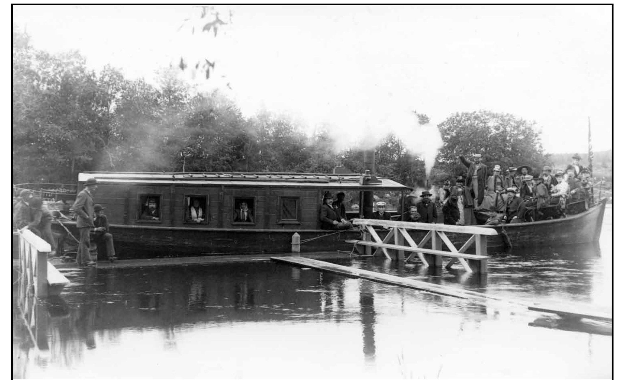
Vanajaveden vilkkaan laivaliikenteen lisäksi mm. yhdistykset vuokrasivat laivoja huviretkiään varten. Kuvassa hämeenlinnalaisia tulossa huviretkelle Lepaan rantaan 1892. Kun kaikki matkustajat eivät mahtuneet laivaan, perässä vedettiin proomua.