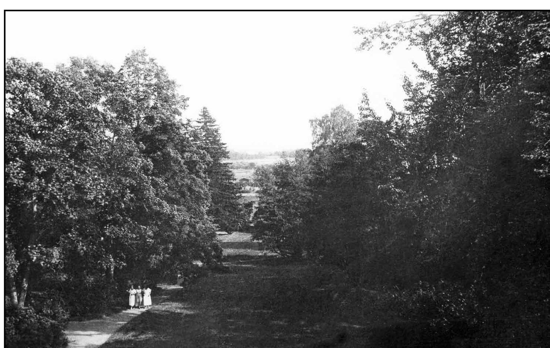
Puistoa 1800-luvun lopulla. Puutarhanhoidolla oli Lepaalla pitkät perinteet. Jo 1760-luvulla Lepaan kartanolla tiedetään olleen kaunis puutarha, hedelmäpuita ja marjapensaita. 1840- ja 1850-luvuilla kartanolle rakennettiin upea englantilaistyylinen puisto. Hedelmätarha tuotti tuolloin ainakin omenia, päärynöitä, kriikunoita, luumuja ja kirsikoita. Omenalajikkeita oli tuotu mm. Pietarista.